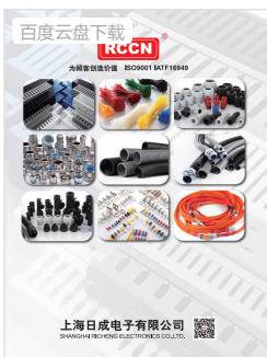
RCCN日成热销产品海报